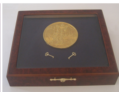
Repräsentative Schatulle mit vergoldetem Relief-Abguss