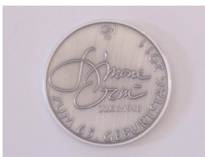
Rs: Zum 65. Geburtstag 2011, Simone Erni