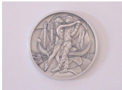
Vs: Tänzerin und Harlekin mit Gondel im Hintergrund